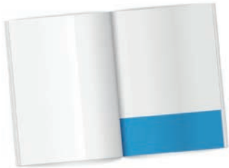
¼ Seite quer