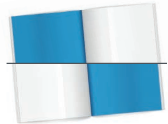
Insidecover vorn (U2) oder hinten (U3)

Ausgabe I: Redaktionsschluss: 06.02., Anzeigenschluss: 09.02. und Druckunterlagenschluss: 19.02.