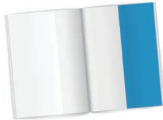
½ Seite hoch