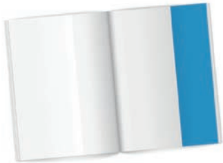
⅓ Seite hoch