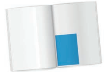
¼ Seite eck